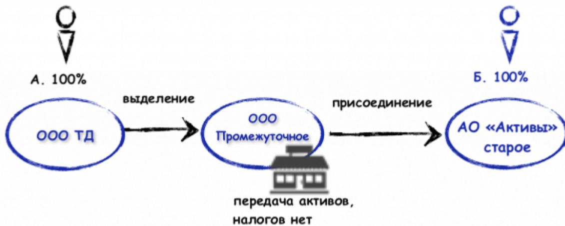
Рисунок 2. Выделение и присоединение юридического лица

Возвращаясь к выделению на третье лицо, стоит отметить, что в отношении АО оно невозможно[34].