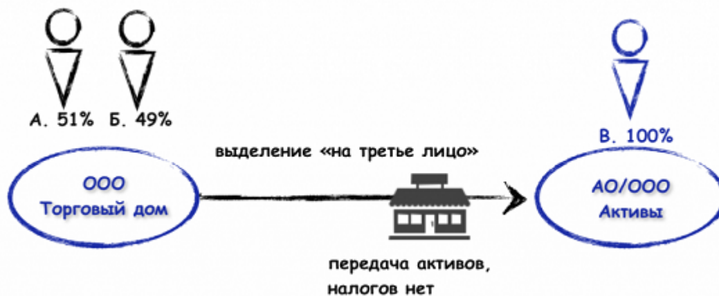
Рисунок 1. Выделение юридического лица

(А) Допускается единая реорганизация с одновременным сочетанием различных ее форм (выделение с присоединением, например).