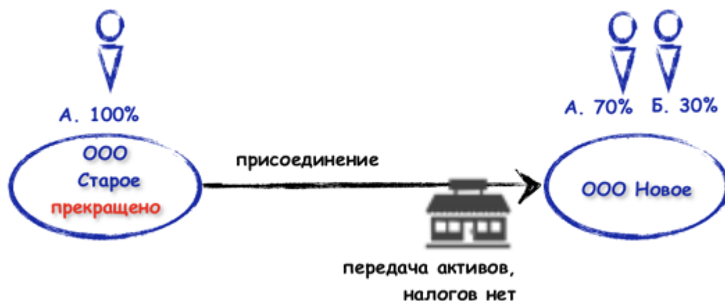
Рисунок 4. Присоединение юридического лица

При присоединении возможно изменить персональный состав участников присоединяющего общества, ст. 53 ФЗ «Об ООО» никаких специальных правил на этот счет не содержит. Присоединение как форма реорганизации не снижает предпринимательских рисков и не повышает уровень имущественной безопасности [45].